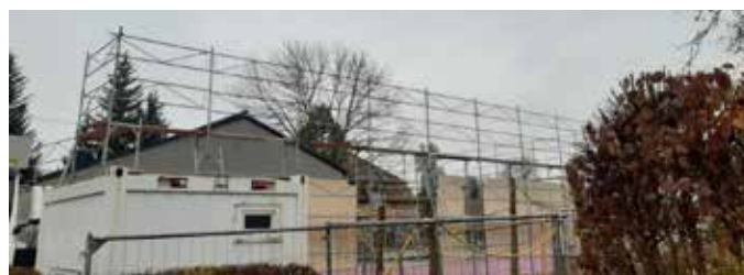
Investitionen in unsere Zukunft passieren gerade in der Linzerstraße 21.