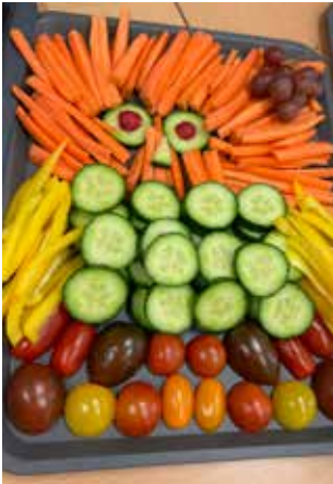
Regional schmeckt besser und bunter!

Unsere heimischen Bäuerinnen und Bauern produzieren Lebensmittel auf den höchsten Umwelt- und Tierschutzstandards und mit bester Qualität. Sie sind vor allem im Bereich Tierhaltung und Nachhaltigkeit internationale Vorreiter. Österreich wurde im Tierwohl-Ranking „World Animal Protection“ unter 50 Ländern gemeinsam mit Schweden mit dem 1. Platz ausgezeichnet.