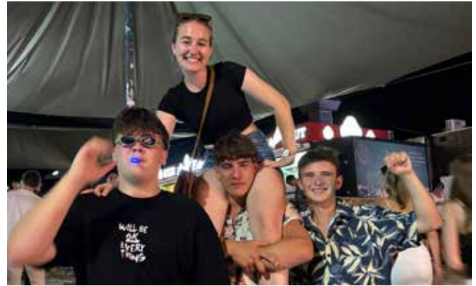
Ein Hoch auf uns, auf dieses Leben, auf den Moment, der immer bleibt.

Ein ganz besonderes Ereignis war unser Fest „Satisfaction“, das am 7. September am Rührmayrgut stattfand. Die Abschlussfeier der diesjährigen „Satisfaction“ am 30. November war ein gelungener Abend des Dankes für alle tatkräftigen Helferinnen. Wir freuen uns schon jetzt auf