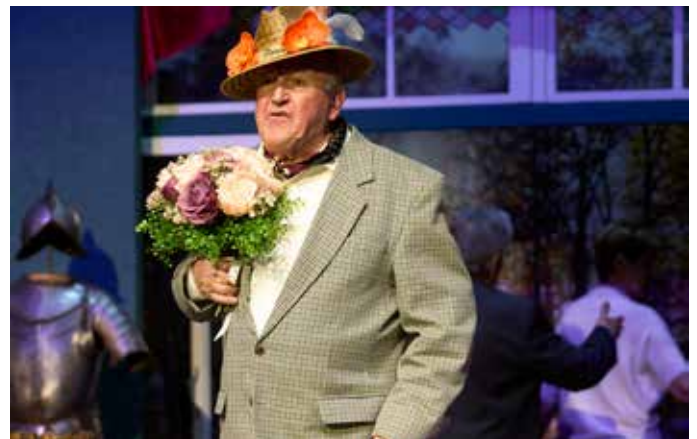
Glücklich macht der Besuch der Aufführungen der Tassilobühne Bad Hall. Herzliche Einladung!