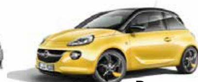
Der neue Opel Adam