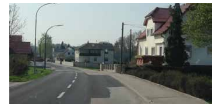
Hier soll links ein Gehsteig entstehen