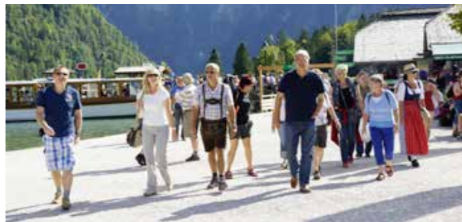
Auch im Urlaub und bei Ausflügen machen wir viele Meter

Suchtprävention ist eines der Beispiele, die seit 2009 konsequent auf professioneller Ebene betrieben werden. Viele haben die monatlichen Sitzungen einmal besucht und wurden nicht mehr gesehen. Übriggeblieben sind als überzeugte Mitarbeiter in Bad Hall die ÖVP Mandatäre. Der große Präventionstag am 7. Juni 2013 war ein sichtbarer Erfolg: rund 500 Kinder und Jugendliche bevölkerten am Vormittag den Park und vergnügten sich bei den Stationen. Ein Dankeschön an alle Schulen, Kindergärten und Institutionen, die sich aktiv beteiligt haben. Herz-