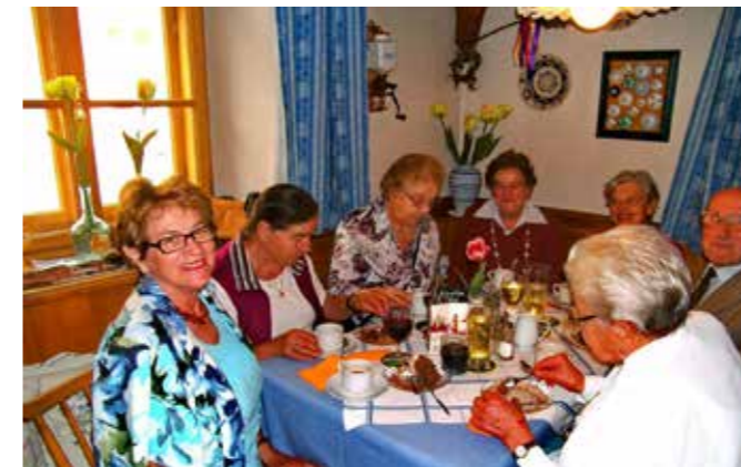
Gute Stimmung bei der Muttertagsfeier

Gemäß diesem Motto haben wir auch heuer wieder unser Programm erstellt und wir freuen uns, dass unsere Mitglieder aktiv daran teilnehmen. Nicht nur das sportliche Training, sondern auch das geistige Training stellt einen wesentlichen Bestandteil unseres Programms dar. So freut es uns ganz besonders, dass am letzten vom Computer Club Bad Hall durchgeführten Grundkurs (Betriebssystem und weitere Grundlagen) wieder drei Mitglieder teilnahmen. In der heutigen Zeit ist es ganz besonders wichtig, dass auch die Generation 60+ - also