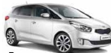
Der neue Kia Carens