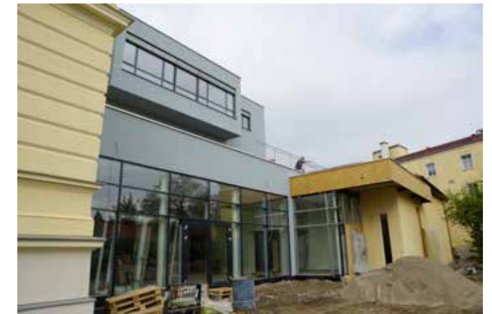
Nicht nur die neue Volksschule wächst und gedeiht

Schule für die gute Zusammenarbeit und das stete Bemühen, das gemeinsame Ziel zu erreichen. In der Gemeinderatssitzung im Mai wurde der letztnotwendige Beschluss gefasst, den Flächenwidmungsplan und das Örtliche Entwicklungskonzept zu ändern. Dadurch werden Flächen für Haus- und Wohnungsbau in größerer Anzahl gewidmet. Einerseits kann der großen Nachfrage nach diesen Flächen nachgekommen werden, andererseits werden Wohnflächen zu leistbaren Preisen entstehen können. Ich bin sehr froh, dass auch