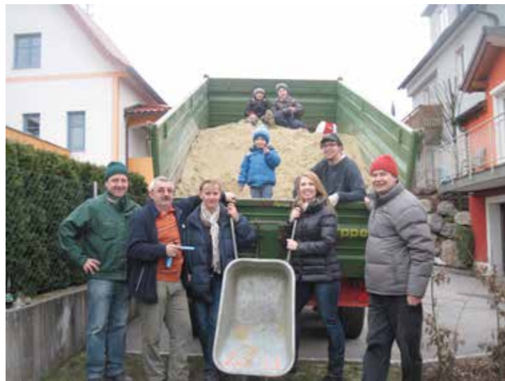
Die fleißigen „Master of Sound“

... das freut sich bereits auf nächstes Jahr, wenn es wieder heißt, die Listen der leeren Kisten abzuarbeiten.